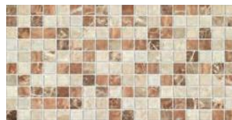
marmi cuadro marfil