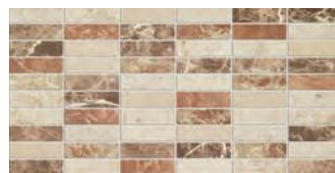
marmi tabla marfil

RVTO / WALL / RVTM: DANTE MARFIL 25 x 50 / MARMI CUADRO MARFIL 25 x 50 PVTO / FLOOR / SOL: DANTE MARFIL 45 x 45